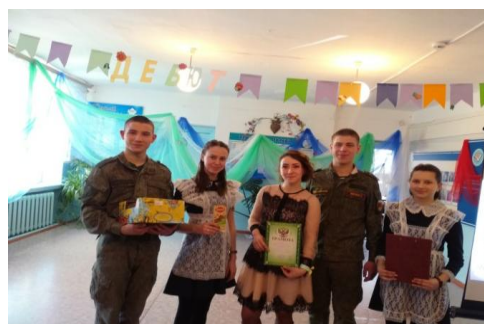
Школьный конкурс для молодых педагогов «Педагогический дебют»