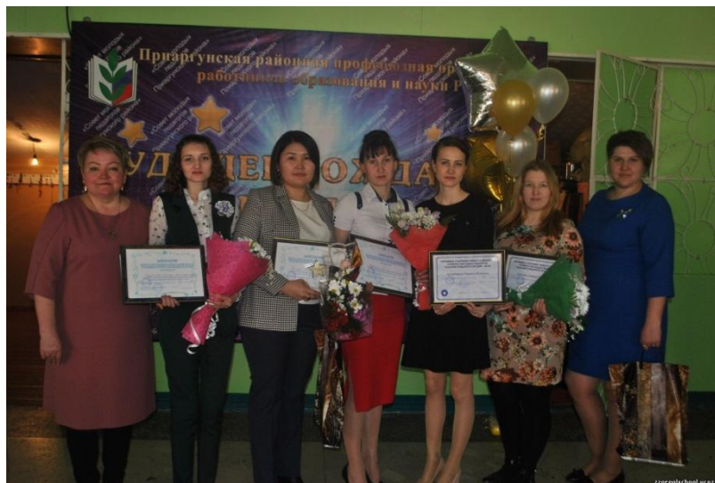
Конкурс молодых педагогов района «Будущее рождается сегодня» 2019 год.

Наставничество — серьезный, ответственный процесс, поэтому большую роль играет изначальная мотивация педагога. Не стоит путать наставничество с тьюторством, менторством и коучингом, поскольку они решают разные задачи.