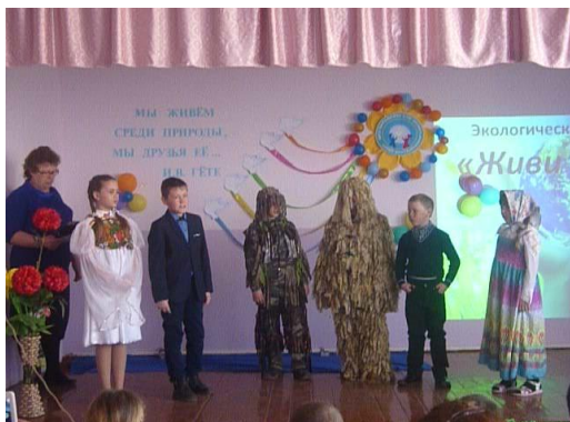
Национальный парк «Алханай»